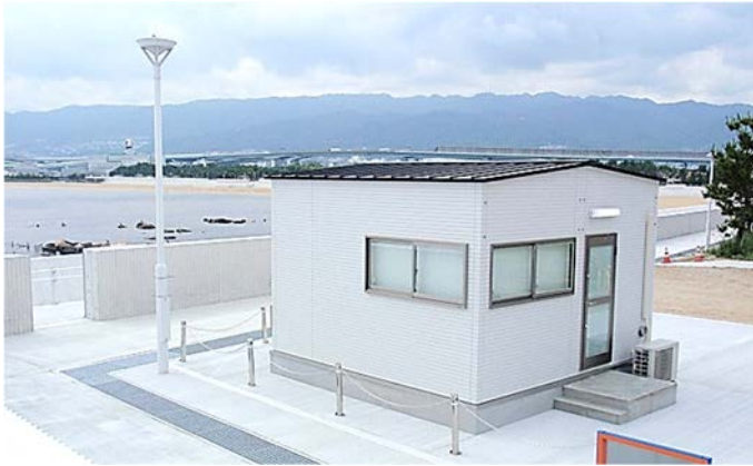
南護岸（周辺整備工事（その1））