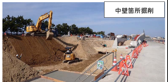
東護岸等（その12工区付近）