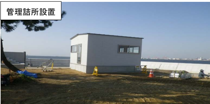
南護岸（周辺整備工事（その1））