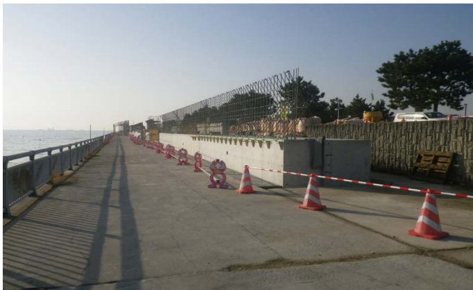
東護岸等（その2工区付近）