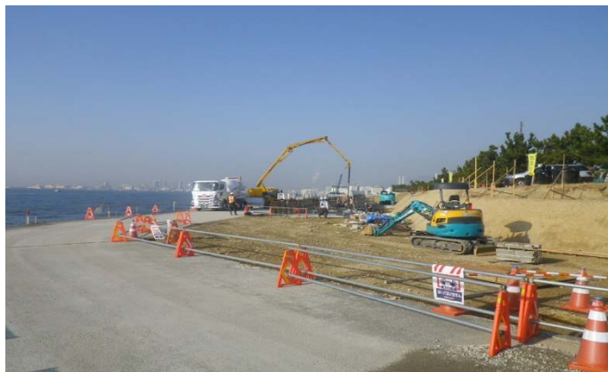
東護岸等（その11工区付近）