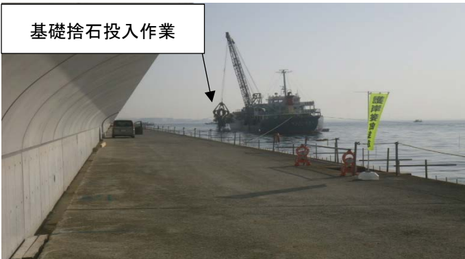
南護岸(その6工区付近)