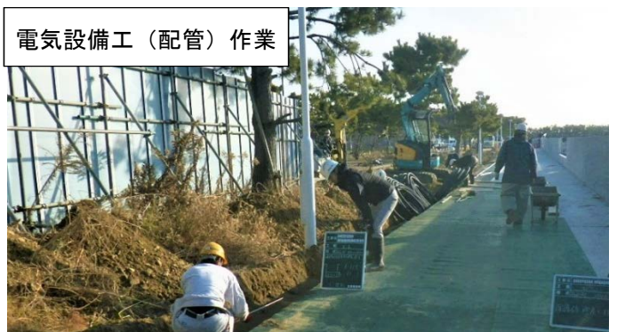
ビーチ護岸(その10工区付近)