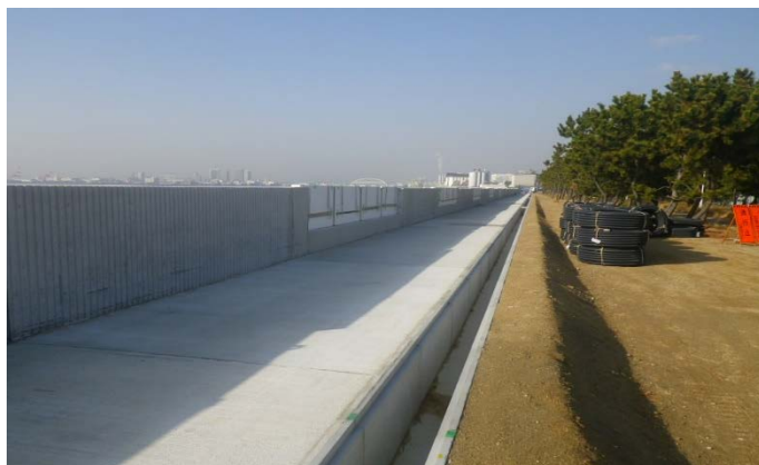
南護岸（その6工区付近）