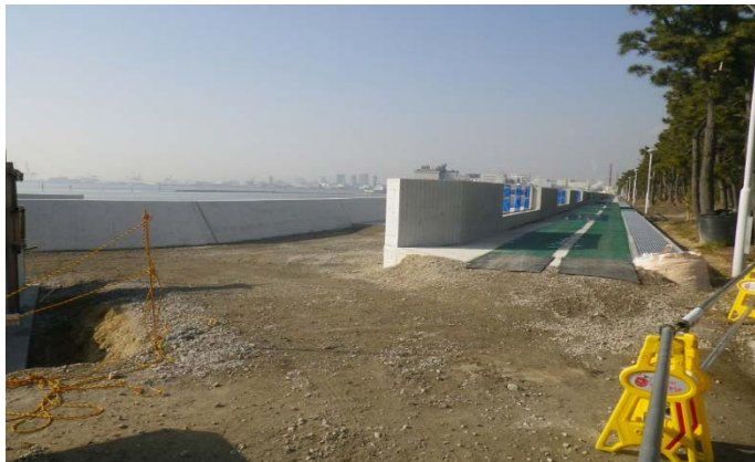
ビーチ護岸（その9工区付近）