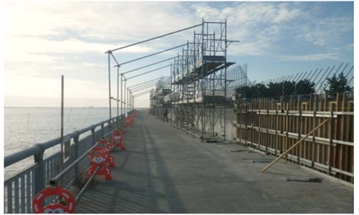
東護岸等（その 1 工区付近）