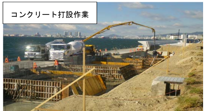
コンクリート打設作業