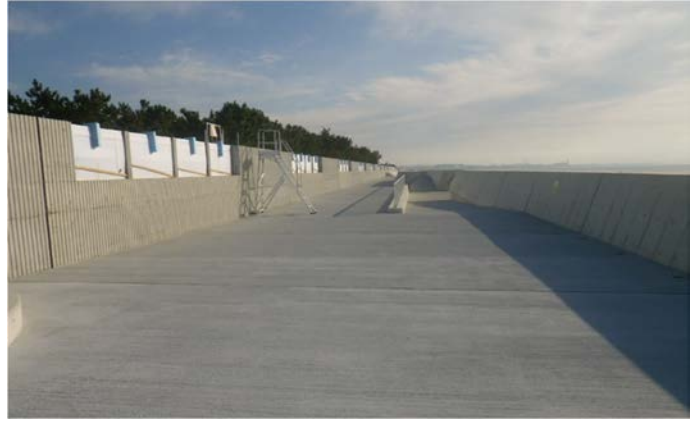
南護岸（その 4 工区付近）