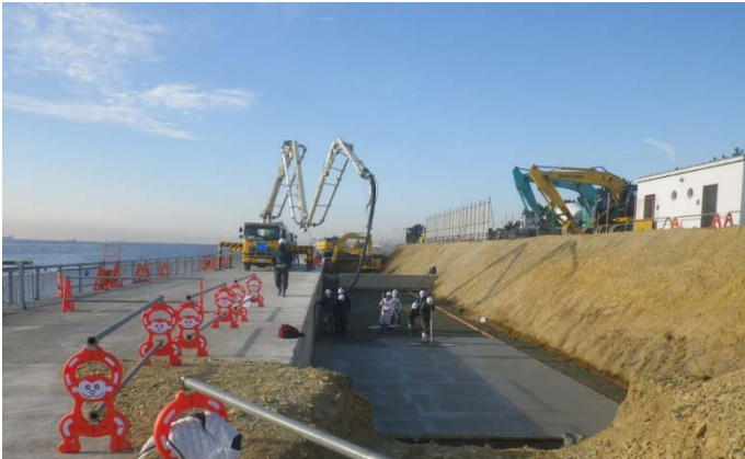
東護岸等（その 12 工区付近）