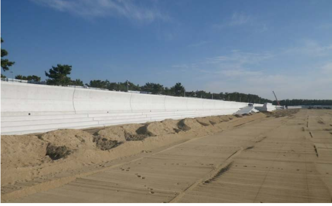
ビーチ護岸（その 10 工区付近）