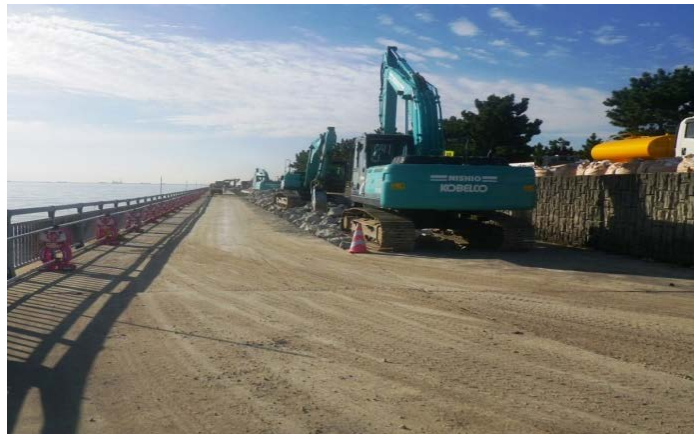
東護岸等（その2工区付近）