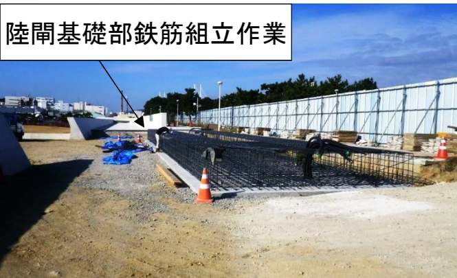
陸間基礎部鉄筋組立作業