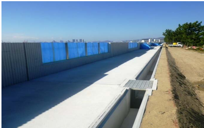
南護岸（その3工区付近）