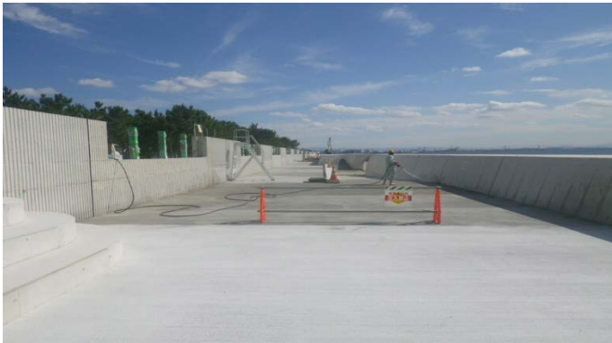
南護岸（その4工区付近）