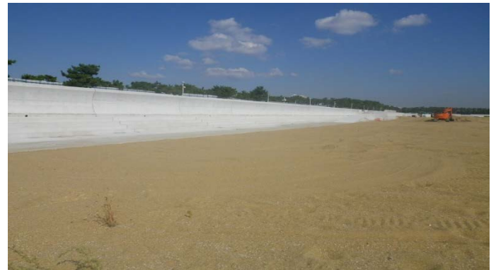
ビーチ護岸（その10工区付近）