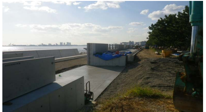
南護岸（その6工区付近）