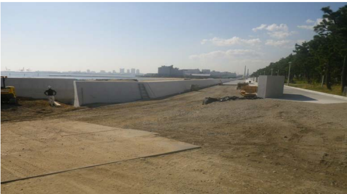
ビーチ護岸（その9工区付近）